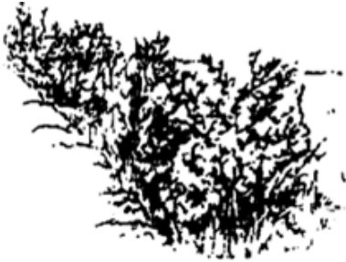
Lossere heg ( bv bloesem- en bessenhaag)

Je kan de haag in losser verband laten uitgroeien tot een bredere heg, ofwel de haag strak scheren en dunner houden.