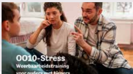
0010-Stress Weerbaarheidstraining voor ouders met tieners

Landelijke Gilde Zandhoven Van 13 tot 18u - Sint-Christoffel