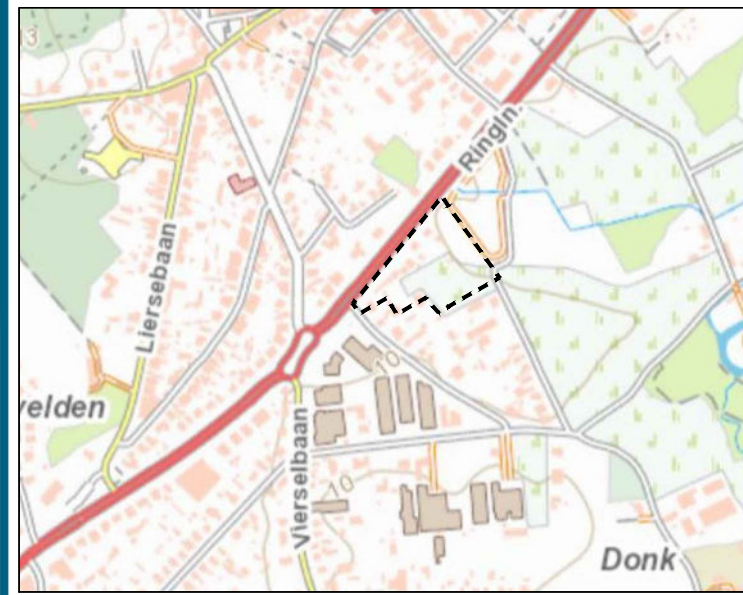
LIGGINGSPLAN 1/10 000